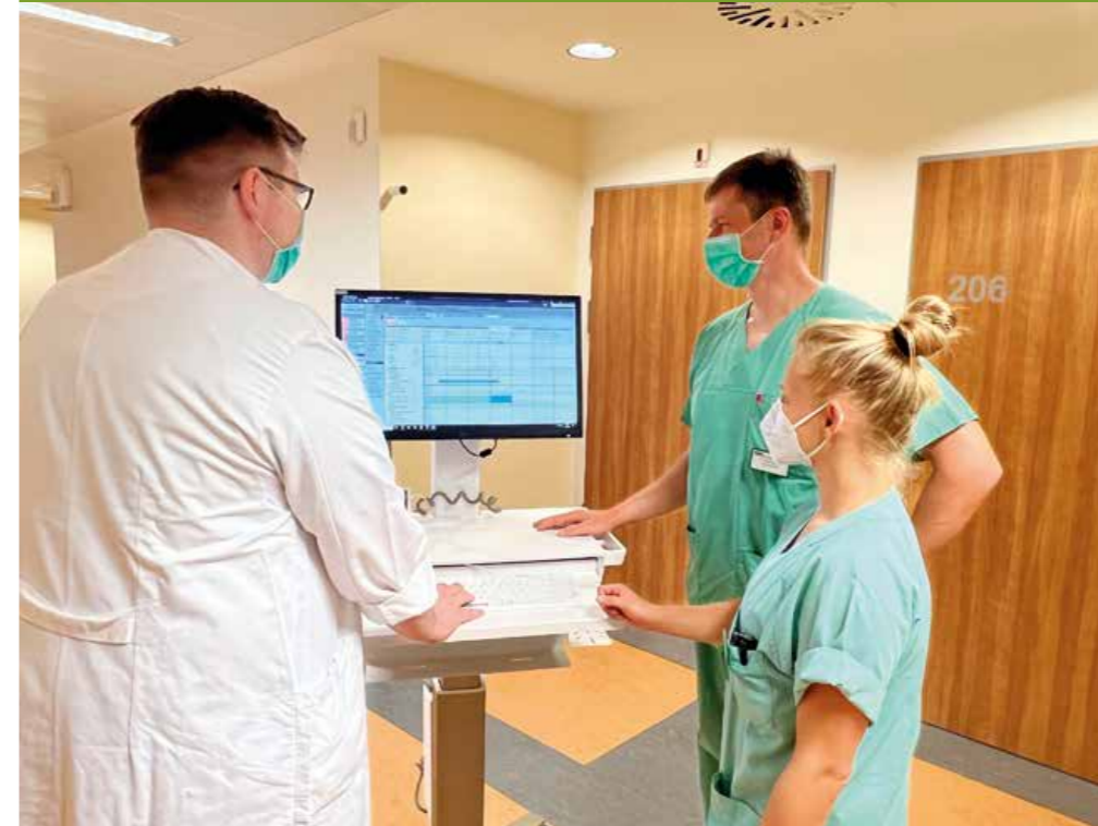
Während der Visite werden Befunde überprüft und ärztliche Anordnungen festgelegt.