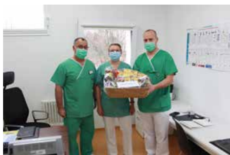
Dezember 2021 Ambulanter OP Standort Kirchberg