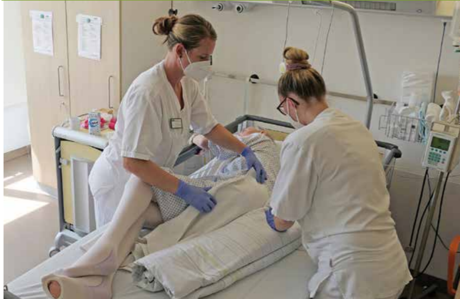
Gemeinsame Lagerung eines Patienten