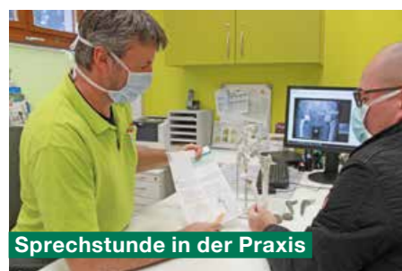
Sprechstunde in der Praxis

Der Entlasstag liegt abhängig von der individuellen Mobilisation zwischen dem 7. und 12. postoperativen Tag. Jeder Patient erhält bei seiner Entlassung einen Arztbrief, ein aktuelles Röntgenbild sowie seinen Endoprothesen-Pass von einem Arzt ausgehändigt. Hierbei besteht nochmals die Möglichkeit, Unklarheiten zu klären und Fragen zu stellen. Abschließend klärt der Arzt über den weiteren Verlauf der Genesung auf. Darüber hinaus findet am Entlasstag eine Abschlussuntersuchung mit Wundkontrolle und Funktionskontrolle statt, nachdem am Vortag die Entfernung der Klammern erfolgte. Aufgrund der Vielzahl der Informationen finden sich wesentliche Aspekte zum Umgang mit einer Endoprothese noch einmal auf einem Informationsblatt, das dem Patienten für zu Hause mitgegeben wird.