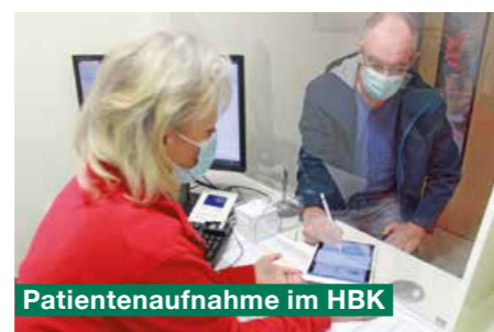
Patientenaufnahme im HBK