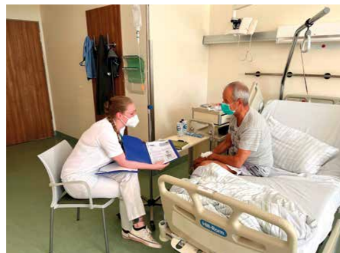
Besuch der Patienten auf Station, um vor Ort alle wichtigen Angelegenheiten zu besprechen und beratend tätig zu sein

Regelmäßige Absprachen mit dem Stationspersonal, das mit den jeweiligen Patienten und Krankheitsverläufen vertraut ist