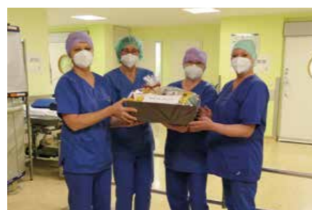
Januar 2022 Stationärer OP Standort Kirchberg