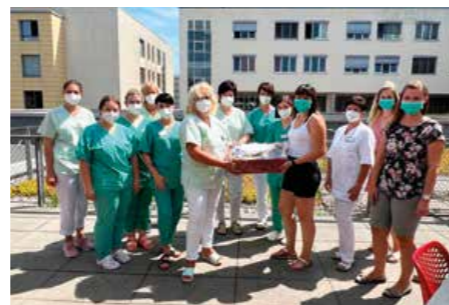
Juli 2022 Geburtshilfe Standort Zwickau