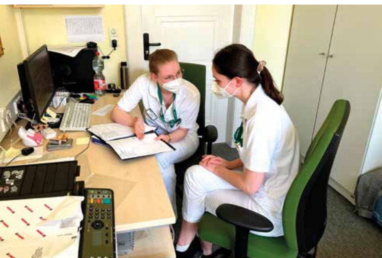
Einweisung einer BA-Studentin in das Aufgabengebiet des Sozialdienstes

von Hilfsmitteln, die zumeist über die Sanitätshäuser erfolgt, sind sie behilflich. Patienten und Angehörige sollen dadurch in erster Linie entlastet werden. Die Lebensqualität, Eigenständigkeit und soziale Integration sollen trotz der gesundheitlichen Veränderungen erhalten werden. Die Sozialarbeiter ermöglichen eine zielgerichtete Kontaktaufnahme, fördern die soziale Kompetenz und stabilisieren den Patienten innerhalb seines sozialen Netzwerks.