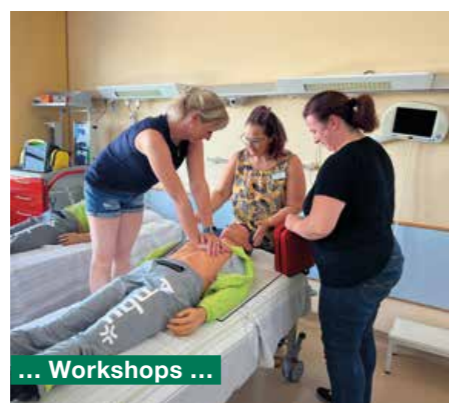
... Workshops ...