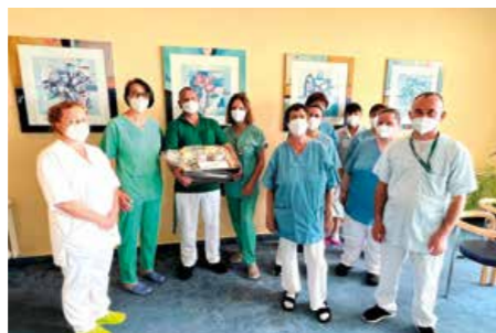
Mai 2022 Radiologie Standort Kirchberg