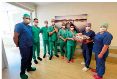
Februar 2022 Intensivstation Standort Kirchberg