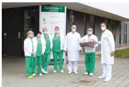
November 2021 Praxis für Chirurgie (Winter/Krauß), MVZ West II Zwickau