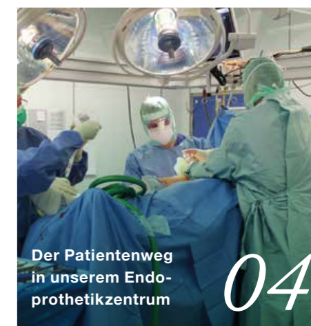
Der Patientenweg in unserem Endo- prothetikzentrum