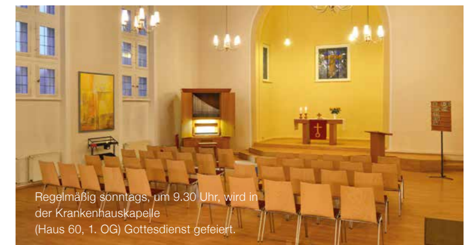
Regelmäßig sonntags, um 9.30 Uhr, wird in der Krankenhauskapelle (Haus 60, 1. OG) Gottesdienst gefeiert.

Heinrich Braun ließ vor über 100 Jahren mit dem Krankenhausneubau in Marienthal eine Kapelle errichten. Dieser eindrucksvolle Raum im Haus 60 ist bis heute erhalten geblieben. Damit war und ist deutlich: Es soll der ganze Mensch im