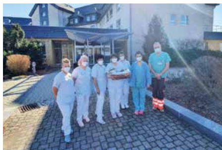
März 2022 Physiotherapie Standort Kirchberg