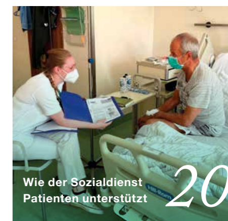
Wie der Sozialdienst Patienten unterstützt