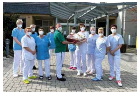
April 2022 Reinigung Standort Kirchberg