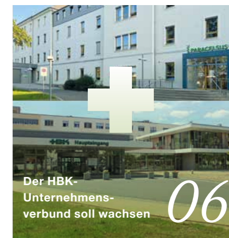
Der HBK- Unternehmens- verbund soll wachsen