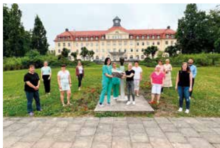
Juni 2022 Personalabteilung Standort Zwickau

Ein Dankeschön von Mitarbeitern für Mitarbeiter – seit Anfang 2021 führen wir diese tolle Aktion durch, bei dem jeden Monat ein Team (durch das nominierte Team des vorherigen Monats) mit einem großen Präsentkorb überrascht wird. In den vergangenen Monaten durften sich folgende Bereiche freuen: